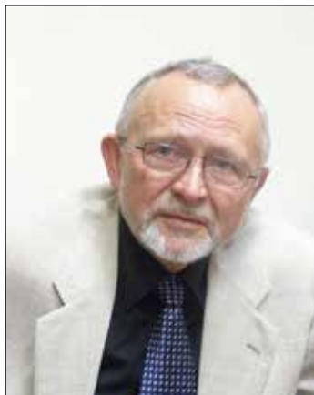
Василь ТКАЧЕНКО, головний науковий співробітник Інституту всесвітньої історії НАН України, доктор історичних наук, професор, член-кореспондент НАПН України