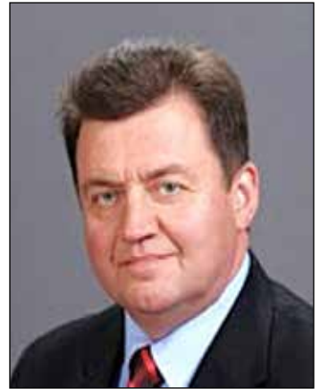
Ігор ЛОССОВСЬКИЙ, заступник Голови Державної служби України з етнополітики і свободи совісті

Новий висновок Венеційської комісії від 9 жовтня 2023 р. констатував врахування багатьох попередніх рекомендацій. Венеційська комісія високо оцінила зусилля української влади, спрямовані на виконання рекомендацій та узгодження положень Закону України «Про