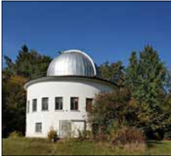
Головний астрономічний обсерваторії НАН України – 80 років