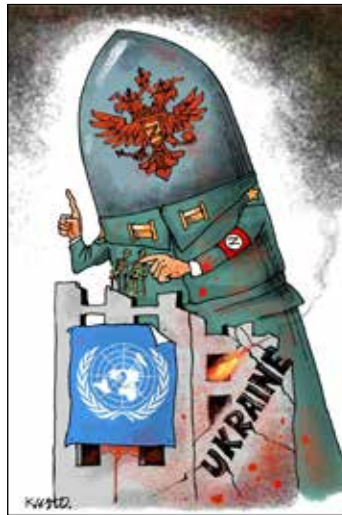
КУСТОВСЬКИЙ Олександр. Головування РФ в ООН