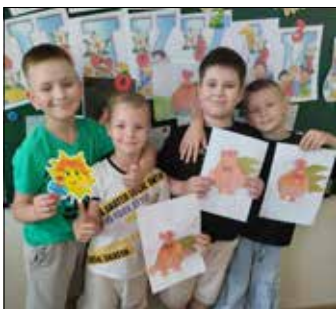
Як провести літо з користю та радістю?