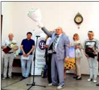
Разом із державою