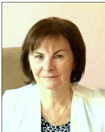
Світлана СИСОЄВА, академік-секретар Відділення філософії освіти, загальної та дошкільної педагогіки НАПН України, доктор педагогічних наук, професор, академік НАПН України

Професіоналізація вчителя як процес передусім, на нашу думку, має бути спрямованою на розвиток таких якостей як адаптивність, стресостійкість, гнучкість, креативність, критичне мислення та передбачати таку підготовку вчителя, що забезпечує усвідомлення широкого спектру соціальних потреб і викликів до країни, суспільства і діяльності, породжених війною російської федерації проти України, озброєння вчителя знаннями, технологіями та новими компетентностями, які дозволяють йому максимально ефективно реалізувати цілі освітнього процесу, утримувати та покращувати якість освіти в умовах невизначеності. Важливим є усвідомлення вчителем власної місії під час війни і тих змін, які привнесені війною у його професійну педагогічну діяльність.