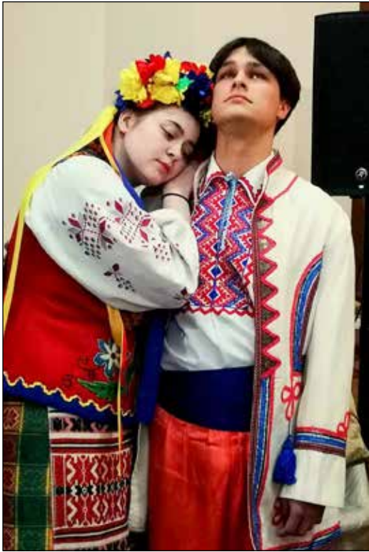
Сцена з вистави «Наречені»