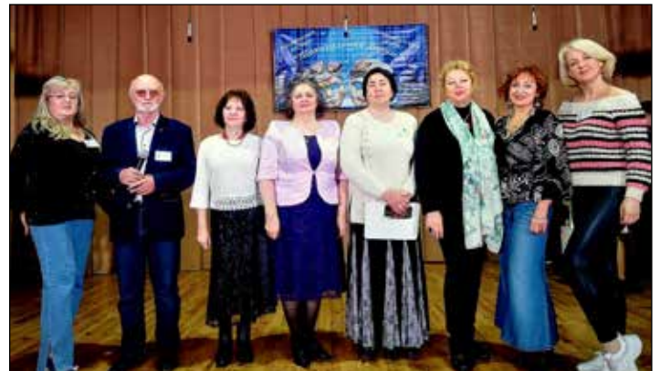
Організатори і члени журі