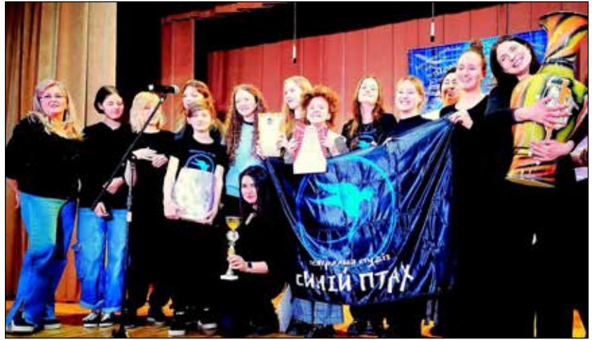
Володар Гран-прі Театральна студія «Синій птах»