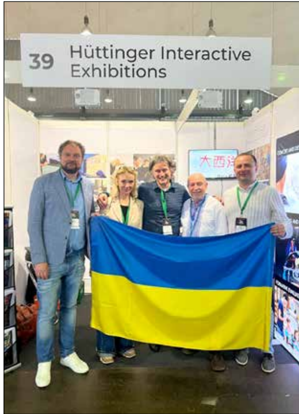
Під час конференції Європейських центрів і музеїв науки (Ecsite – European network of science centres and museums). Любляна, Республіка Словенія. 2024 рік.