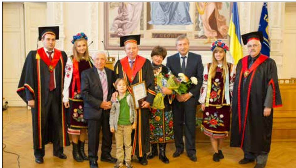
Почесний доктор НТУУ «КПІ» Станіслав Довгий. Поруч – батьки й молодший син Станіслав. 2014 рік.

ної нестационарної динаміки, що поєднує аналітичні, обчислювальні та експериментальні методи. Є автором понад 300 наукових праць, 38 патентів й авторських свідоцтв, 42 монографій, підручників та енциклопедичних видань (самостійно та у співавторстві) у сфері обчислювальної математики, математичного моделювання, обчислювального та фізичного експерименту, геодинаміки навколишнього середовища, інформаційно-комунікаційних технологій тощо.