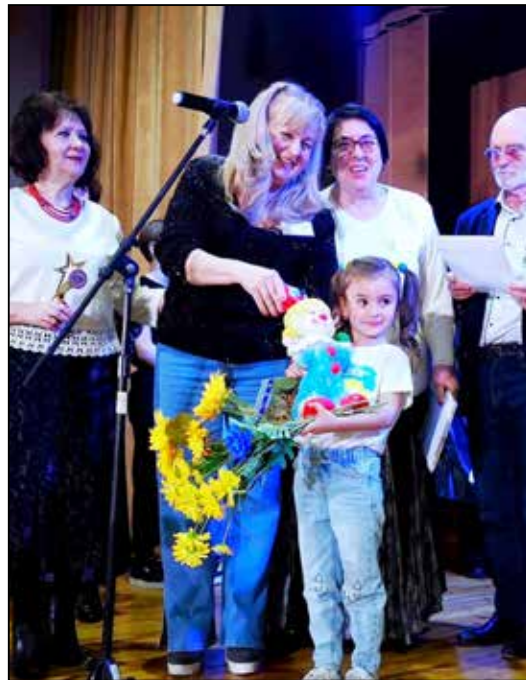
Аплодисменти наймолодшій учасниці