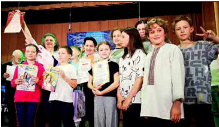
Дитячий зразковий театр «Кредо»