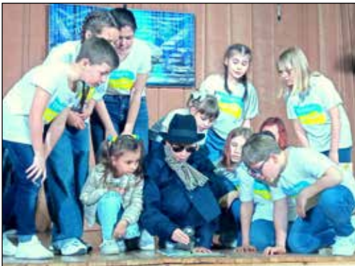
Сцена з вистави «Кілька історій про маму»