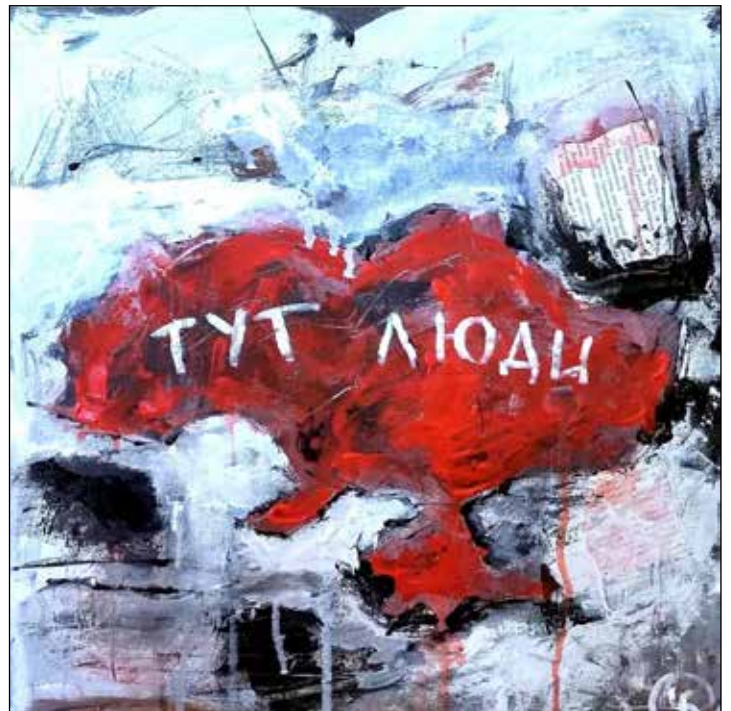
Богдана Чилікіна. Тут люди