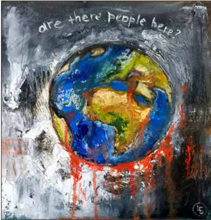
Богдана Чилікіна. Чи є там люди?