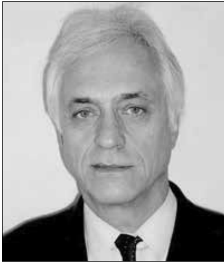
Валерій БИКОВ, директор Інституту цифровізації освіти НАПН України, доктор технічних наук, професор, академік НАПН України

Цифровізація може розглядатися у різних ракурсах, кожному з яких притаманні відповідні об'єкти і взаємозв'язки. Цифрову трансформацію суспільства доцільно розглядати в таких смислових аспектах: